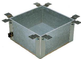
ろ だ ん う 炉 壇 受 け 16型 JC1151

炉壇(炭点前用)および電気炉壇を設置する際には炉壇受けが必要です。 炉壇受けの中に炉壇(炭点前用)または電気炉壇を設置して使います。 組合わせ内容に応じた型式をご選択ください。