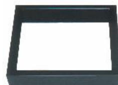
ろぶち しんぬり JC1171 炉縁 真塗

○各製品の詳細はP4以降に掲載がございます。○炉壇受けは組立式です。○組立方法および施工要領書は製品に同封されております。 ○ご注文の際には御流儀をお申し出ください。炭形状および五徳の向きが異なります。