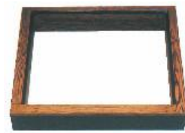
ろぶち やきすぎ 炉縁 焼杉 JC1172