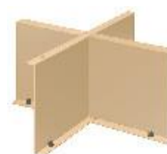
う あ し 受 け 脚 JC1153