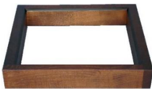
ろぶち めくわ 炉縁 女桑 JC1174