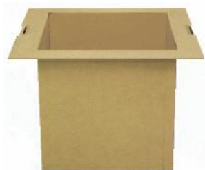
ろだん すみてまえよう JC1131 炉壇(炭点前用)