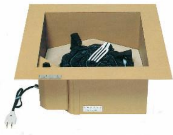
でんきろだん 電気炉壇 16型 JC1141

炭灰を使用しない電気式の炉壇です。 燃焼を伴わないので一酸化炭素中毒の危険がありません。 床下深さが113mmより浅い場合は置炉(P6)をご選択ください。