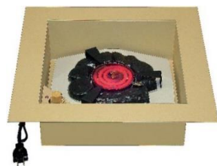
でんきろだん 電気炉壇 12型 JC1142

○炉壇(炭点前用)と組合わせて使用する事も可能です。P1に掲載がございます。 ○設置する際は炉壇受け(16型もしくは30型)が必要です。炉壇受け30型を選択した場合には受け脚も必要です。 ○ご注文の際は御流儀をお申し出ください。炭形状および五徳の向きが異なります。