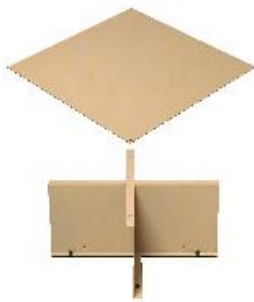
うだい (専用) 受け台