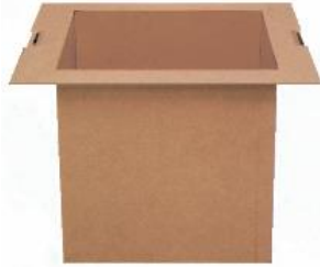
ろだん (専用) 炉壇