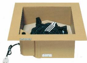
でんきろだん JC1114 電気炉壇16型