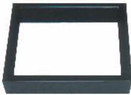
ろぶち しんぬり 炉縁 真塗 JC1171 JC1176(高 30)