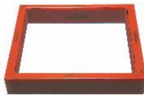
ろぶち ねごろ 炉縁 根来 JC1173