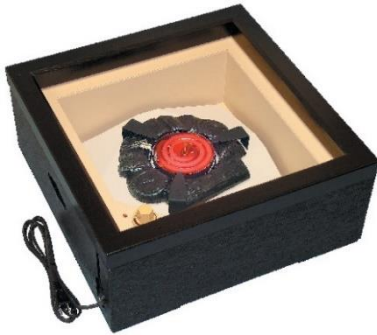
おきろ くら 置 炉 黒 JC1161