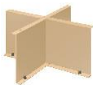
うあし JC1153 受け脚