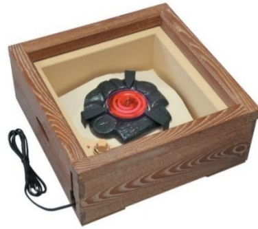
おきろ めくわ 置 炉 女桑 JC1162