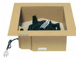
でんきろだん JC1141 電気炉壇16型