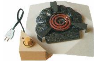
すみがたでんき (専用) 炭型電気ヒーター