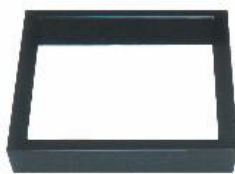
ろぶち しんぬり JC1171 炉縁 真塗