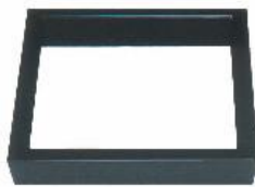
ろぶち しんぬり JC1171 炉縁 真塗