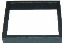
ろぶち かきあ 炉縁 柿合わせ JC1175 JC1177(高 30)