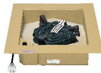
でんきろだん 電気炉壇 11型 JC1143

○床下深さを168mmとれず電気炉壇16型を設置できない場合に採用ください。 ○炭形ヒーターおよび五徳の高さを抑えた事で、11型よりもお釜が低く納まります。 ○専用の炉壇受けはございませんので周囲を耐熱ボードなどで囲ってください。 ○御流儀に合わせて五徳の向きをご自身で調整して頂けます。