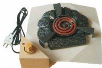
すみがたでんき JC1144 炭型電気ヒーター