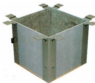
ろ だ ん う 炉 壇 受 け 30型 JC1152